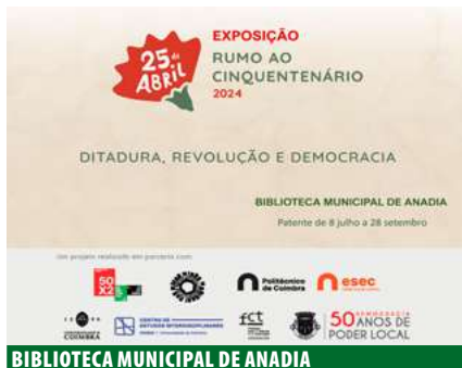
BIBLIOTECA MUNICIPAL DE ANADIA