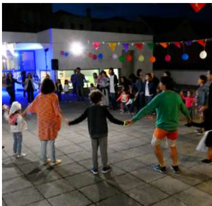
BIBLIOTECA MUNICIPAL DE ESTARREJA