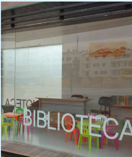
BIBLIOTECA MUNICIPAL JOÃO GRAVE – VAGOS