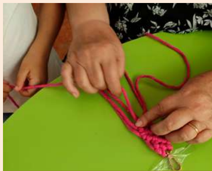
BIBLIOTECA MUNICIPAL JOÃO GRAVE – VAGOS

Promotor Município de Aveiro Público-alvo Público em geral