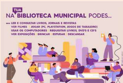
BIBLIOTECA MUNICIPAL DE ALBERGARIA-A-VELHA