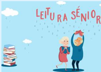
BIBLIOTECA MUNICIPAL DE OLIVEIRA DO BAIRRO

Promotor Município de Vagos Público-alvo Público em geral