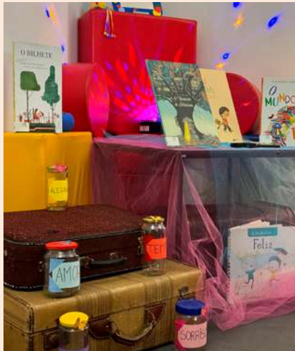
BIBLIOTECA MUNICIPAL MANUEL ALEGRE – ÁGUEDA