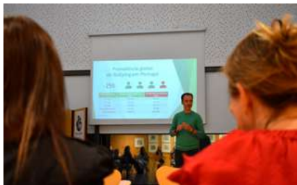
BIBLIOTECA MUNICIPAL DE ÍLHAVO