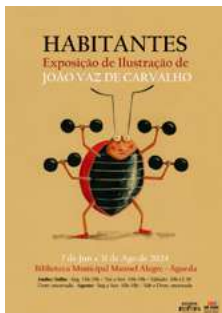
BIBLIOTECA MUNICIPAL MANUEL ALEGRE – ÁGUEDA