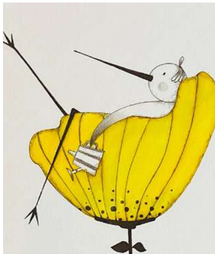
BIBLIOTECA MUNICIPAL DE SEVER DO VOUGA