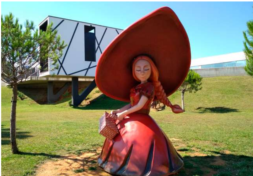
BIBLIOTECA MUNICIPAL DE ANADIA