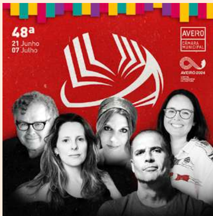
BIBLIOTECA MUNICIPAL DE AVEIRO